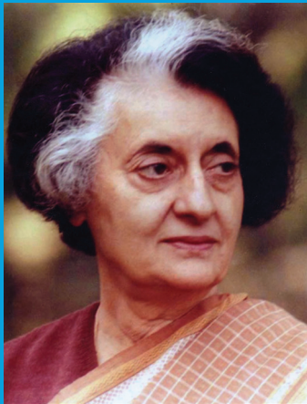
Indira Gandhi, Perdana menteri India

Amati foto-foto berikut! Tuliskan kesederajatan dalam hal apa yang tampak dalam gambar tersebut! Bagaimana pendapatmu tentang kesederajatan berikut?